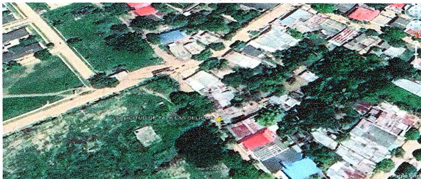
Imagen 1. Barrio Las Delicias – Magangué

En virtud de lo anterior el subdirector de Gestión Ambiental de la CSB, comisiona a los suscritos, para atender el asunto arriba señalado y emitir el respectivo concepto técnico.