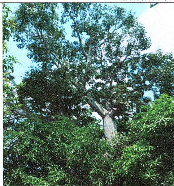
fotografía 1: Evidencia de la altura del árbol