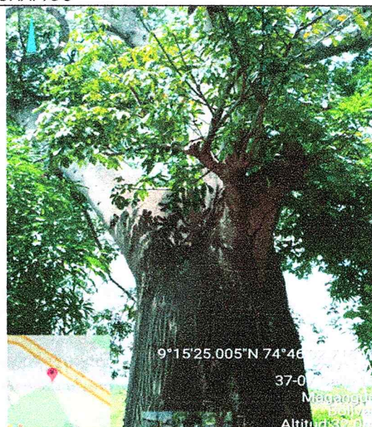
fotografía 1: Vista general del árbol de Ceiba